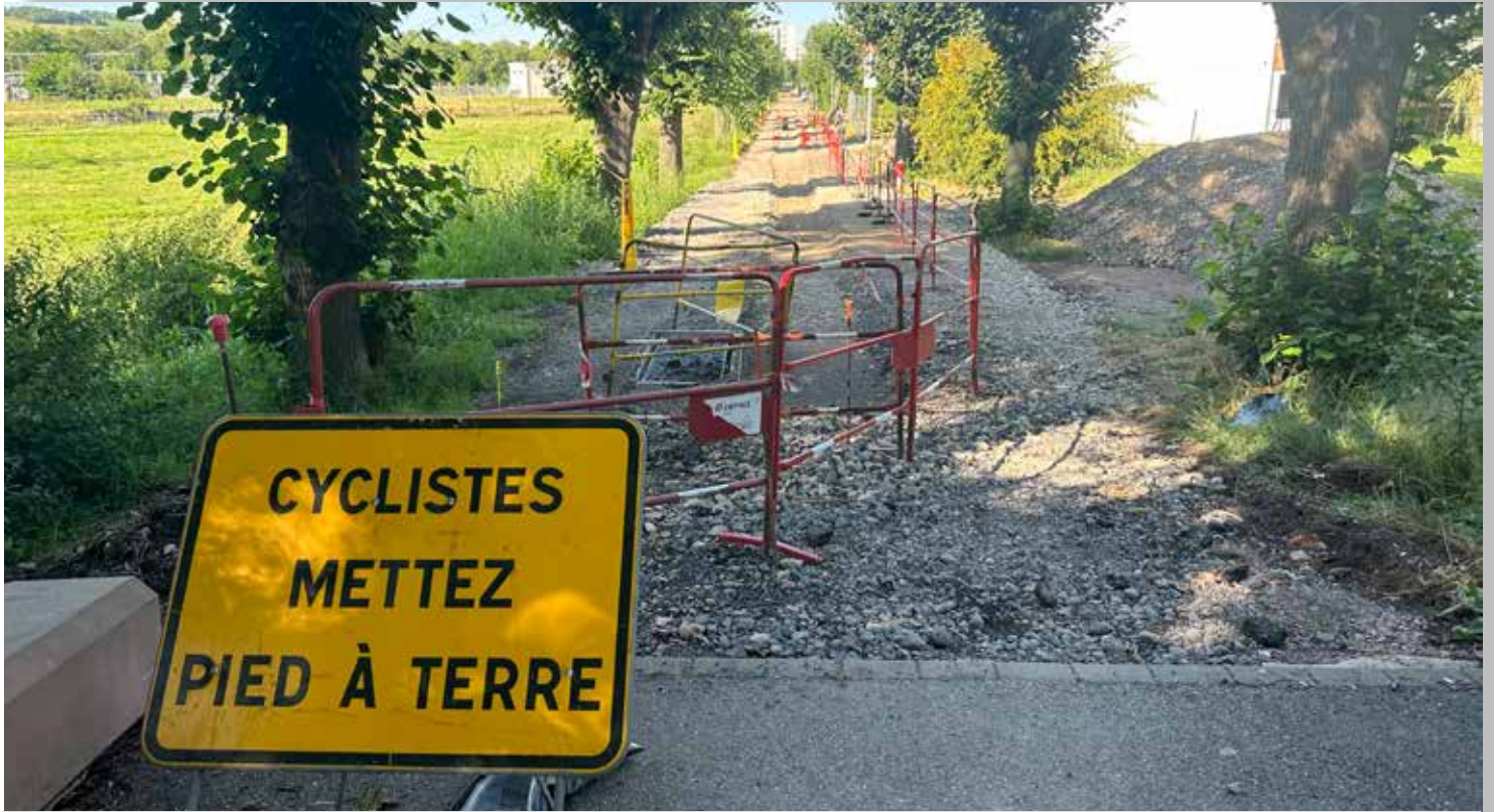
Pose des enrobés Chemin de Dorlisheim

Fin mars, la Communauté de communes de la région de Molsheim-Mutzig a entrepris des travaux de rénovation du réseau d'eau potable du Chemin de Dorlisheim.