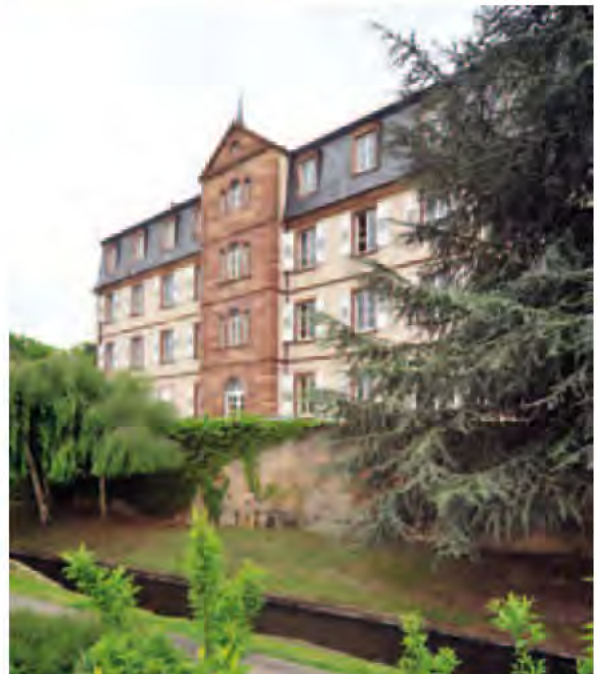
En 1985, le lycée d'enseignement professionnel situé avenue de la Gare est officiellement dénommé lycée Camille Schneider.