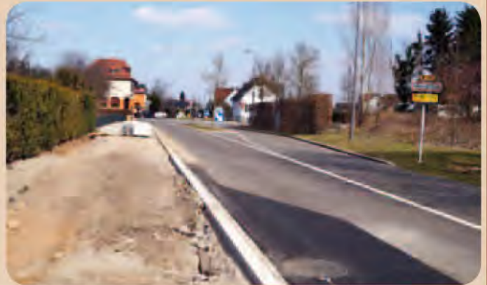
La piste cyclable reliant Molsheim à Dachstein-Gare devrait être opérationnelle cet été.

Les utilisateurs de la piste cyclable longeant la route d'Ernolsheim (RD 93) devaient jusqu'à présent emprunter la départementale RD 30 après le pont du contournement pour se rendre à Dachstein-Gare. Afin de poursuivre sa politique de développement des modes de circulation douce, la Ville de Molsheim renforce le maillage des pistes cyclables existant sur le territoire. Sous l'égide de la Communauté de communes de la région de Molsheim-Mutzig, il sera désormais possible, dès cet été, de relier à vélo Molsheim à Dachstein-Gare en toute sécurité.