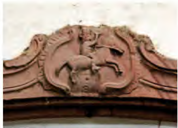
Linteau en grès sculpté du XVIII e siècle (en réemploi) représentant un militaire à cheval ou "hussard" ? (8, rue des Sports).