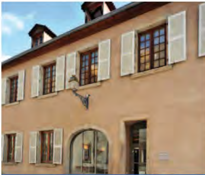
En 1992, après un travail d'aménagement titanesque, la médiathèque ouvre ses portes et offre à ses adhérents un espace culturel inédit.

En 1972, la bibliothèque municipale est installée au Centre socioculturel. Elle abrite 4 930 ouvrages, dont 2 350 en langue française et 2 570 en langue allemande. 20 ans plus tard, après la réhabilitation de l'ancienne cuisine et du réfectoire des Chartreux alors occupés par la Fondation Jenner, la médiathèque ouvre ses portes avec un stock de 5 000 CD et 20 000 livres. L'inauguration officielle se déroule en mai 1993 en présence de Daniel Hoeffel, alors ministre de l'Aménagement du territoire et des Collectivités locales.