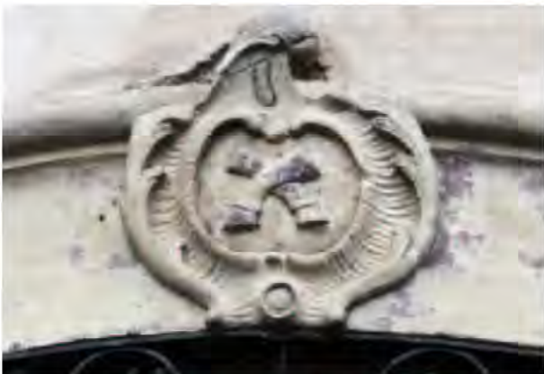
Linteau sculpté de l'auberge "Au Pied de Bœuf", montrant deux pattes de bovin disposées en sautoir, surmontant une belle grille en fer forgé de 1762 (1, rue de Strasbourg).

Les brasseries étaient rares : on y écoulait plutôt le vin du cru et, lorsqu'ils exploitaient quelques arpents de vignes, les tenanciers servaient parfois leur propre production. Depuis le XV e siècle, plusieurs dizaines d'établissements différents sont ainsi attestés à Molsheim, où le Musée municipal conserve également deux belles enseignes métalliques : celle de l'auberge du Lion d'Or et celle de l'hôtel Zu den zwei Schlüssel représentant respectivement un lion doré et deux grosses clefs entrecroisées.