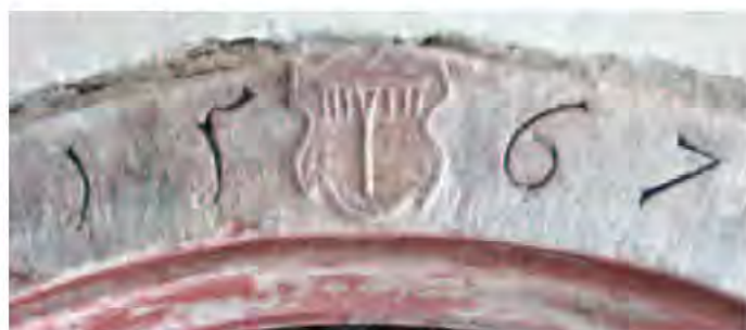
Emblème anonyme représentant un râteau, sur l'arc en plein-cintre d'une cave, portant le millésime 1567 (15, rue Saint-Georges).