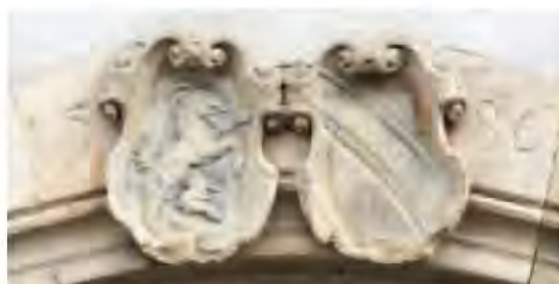
Armoiries jumelées des "Böcklin von Böcklinsau" sur une porte cochère de 1586. L'écu de gauche porte un bouc (en all. "Bock"), emblème du propriétaire de la maison, tandis que celui de droite correspond aux armes de la ville de Strasbourg (7, rue des Vosges).

Douze ans plus tard, le 25 mai 1598, la veuve d'un autre Böcklin von Böcklinsau vend aux pères chartreux la cour domaniale dite Böcklerhof , pour la coquette somme de 5 000 florins. Située à l'emplacement de l'actuelle cour des Chartreux, cette propriété disparue est à considérer comme le noyau primitif de l'ancienne Chartreuse de Molsheim.