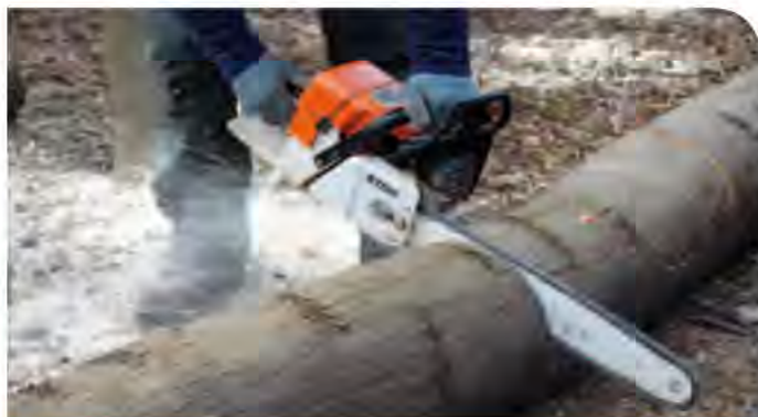
Attention, car élagage, tronçonnage et tranquillité du voisinage ne font pas bon ménage.