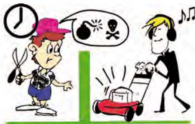
Passer la tondeuse c'est possible, mais uniquement du lundi au samedi de 8 h à 20 h et le dimanche de 9 h à 12 h.

Avec le retour des beaux jours, il est bon de préciser que les amoureux du bricolage et du jardinage doivent respecter certaines règles de bienséance. Ainsi tondeuses, perceuses, raboteuses, scies mécaniques et autres engins bruyants sont utilisables du lundi au samedi de 8 h à 20 h ; les dimanches et jours fériés de 9 h à 12 h. Le reste du temps, il est préférable de s'adonner à des activités plus silencieuses et respectueuses de son voisinage.