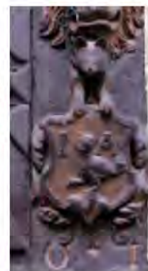
Emblème de bourgeois sur une fenêtre en bois sculpté, datée de 1601, montrant un volatile indéterminé et les initiales I.A. du propriétaire (17, rue des Étudiants).

Dans l'exemple suivant, l'objet représenté -un râteau de jardinier- est facilement identifiable, sauf que cet emblème professionnel est rarissime. A notre avis, cet outil peut aussi évoquer le nom d'un ancien propriétaire, par exemple Recht , qui aurait choisi un râteau (en all. " Rechen ") comme blason.