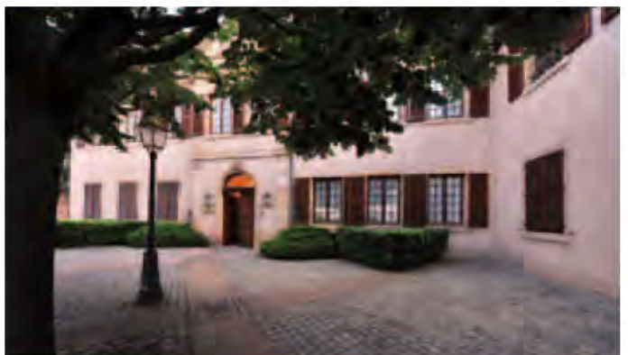
Grâce à la volonté du maire honoraire et de son équipe municipale, le site de la Chartreuse a pu être sauvegardé. Sa rénovation se poursuit encore de nos jours