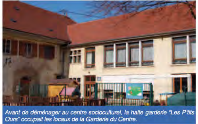
Avant de déménager au centre socioculturel, la halte garderie "Les P'tits Ours" occupait les locaux de la Garderie du Centre.