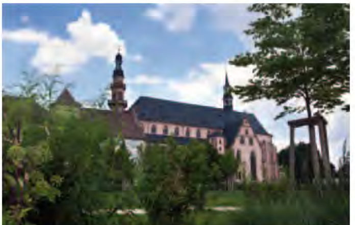
Fier de "son" église paroissiale, Pierre Klingenfus coordonne d'importants travaux de rénovation et de restauration.