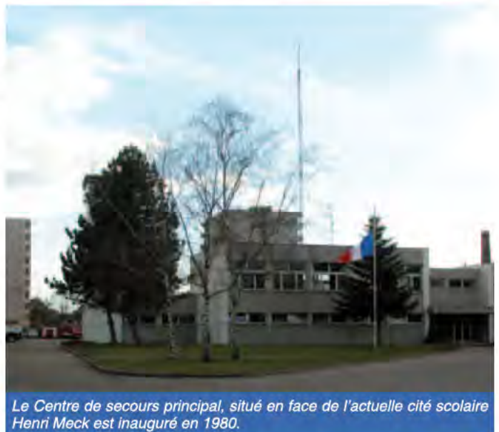
Le Centre de secours principal, situé en face de l'actuelle cité scolaire Henri Meck est inauguré en 1980.