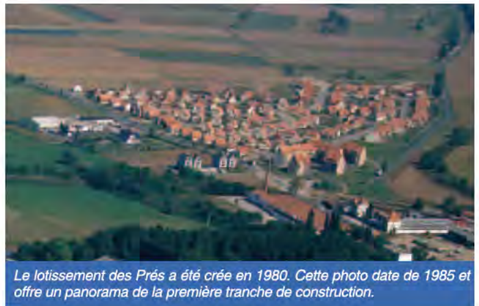
Le lotissement des Prés a été créé en 1980. Cette photo date de 1985 et offre un panorama de la première tranche de construction.