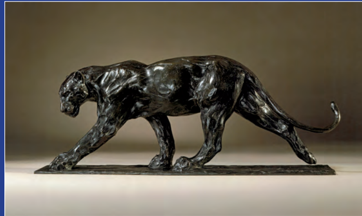
« Panthère marchant », de Rembrandt BUGATTI (1904)