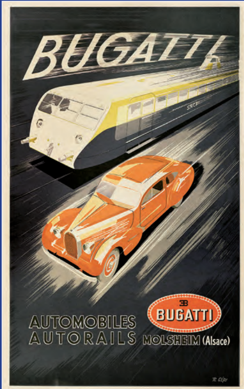
Affiche publicitaire (1935)