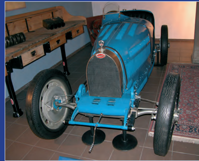
Bugatti de course type 35 (1926) Bugatti Rennwagen Typ 35 (1926) Bugatti's racing car model 35 (1926)