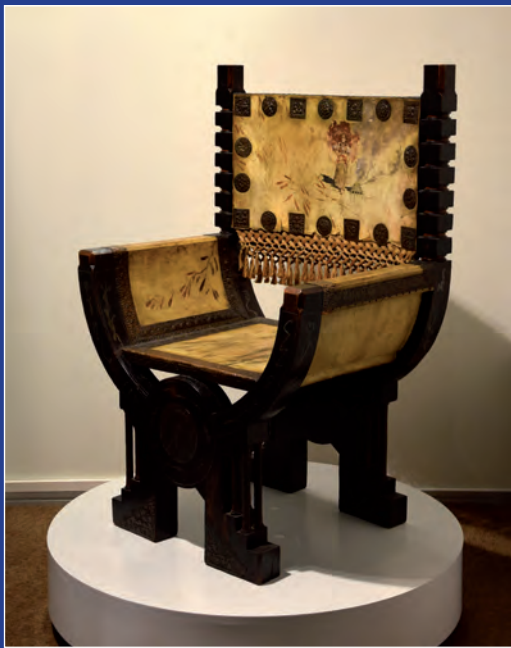
Fauteuil curule de Carlo Bugatti (vers 1902)