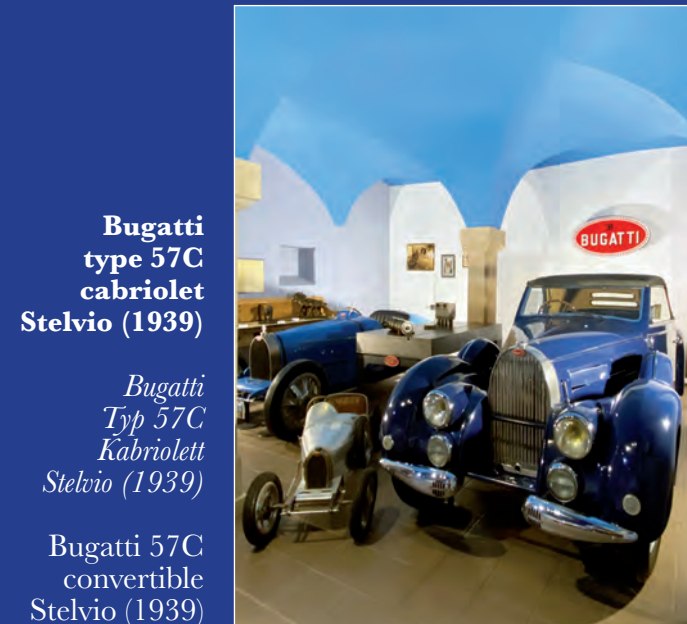
Bugatti type 57C cabriolet Stelvio (1939)